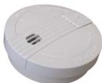
FDA-728-S opticko kouřový EN 14604

Autonomní detektory se sirénou napájené baterií