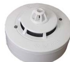
FDR-36-SHR teplotní – kouřový EN54 - 5,7

Autonomní detektory se sirénou napájené baterií