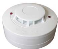
FDR-16-HR teplotní EN54 - 5

Detektory s výstupem relé určené jako doplněk EZS napájené 12V= pro EN54 nutné zajistit jednoznačné dohledání poplachu z detektoru – jeden detektor jedna smyčka