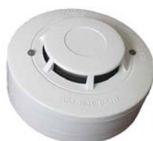
FDR-26-S opticko kouřový EN54 – 7